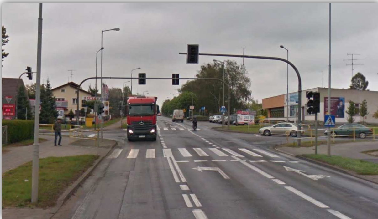
DW 184 w m. Szamotuły, ul. Jana Pawła II