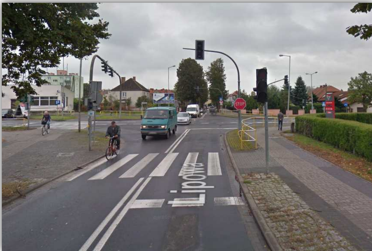
Szamotuły, ul. Lipowa (widok na skrzyżowanie z drogą wojewódzką nr 184)