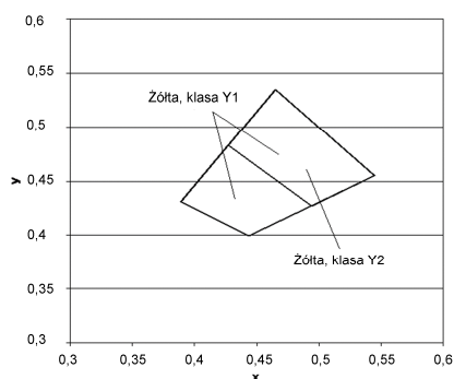
Rys.2. Współrzędne chromatyczności x, y dla barwy żółtej oznakowania